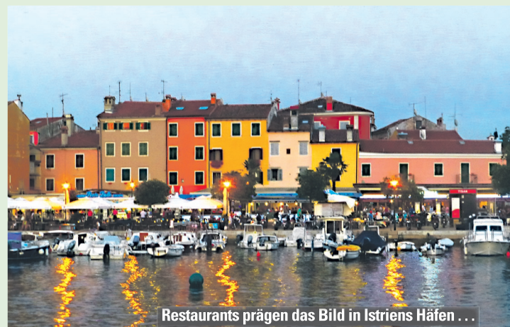
Restaurants prägen das Bild in Istriens Häfen ...

schenzeitlichem Prestigeverlust wieder einen Platz im lokalen Angebot – hergestellt aus erstklassigen Zutaten, versteht sich.