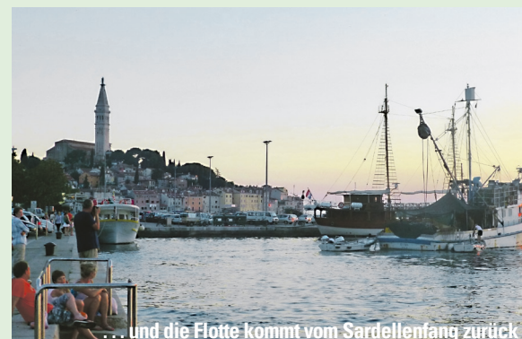
... und die Flotte kommt vom Sardellenfang zurück